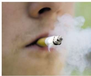
Rauchen ist ungesund, das weiß jedes Kind. Trotzdem rauchen viele Menschen. Immerhin: Die Zahlen sind seit Jahren rückläufig.

Hypnose funktionierte.“ Mit Hilfe der angewandten Statistik will er nun auch wissenschaftlich über die Wirksamkeit urteilen können. „Unso wert Studienteilnehmer wir haben, umso besser“, erklärt